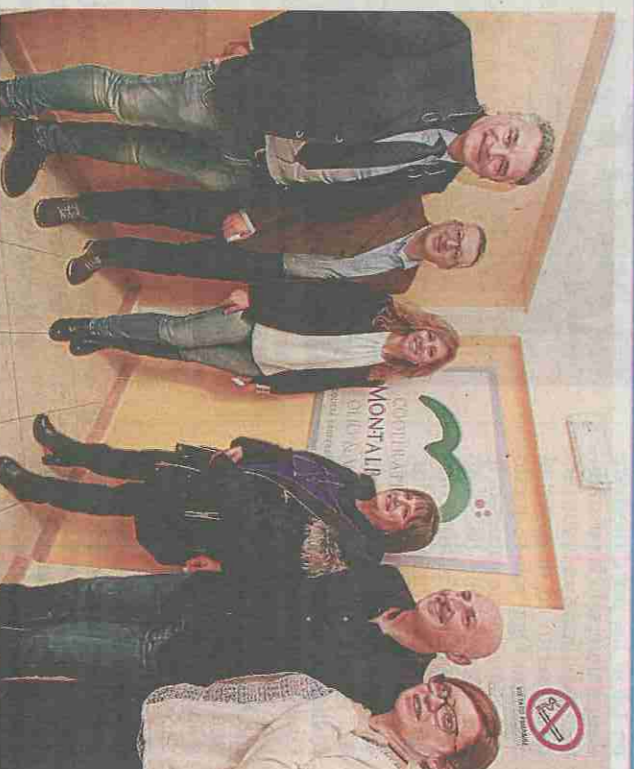
Dirigenti della Montalbano e delle associazioni degli agricoltori dopo l'annuncio dei fondi ottenuti per la 'cura' degli olivi